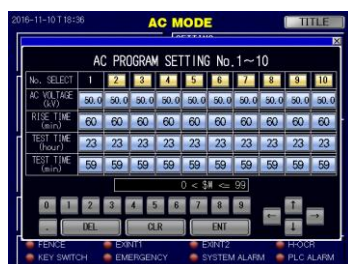
交流電圧発生試験 PROGRAM モード