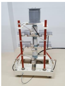
インパルス試験装置