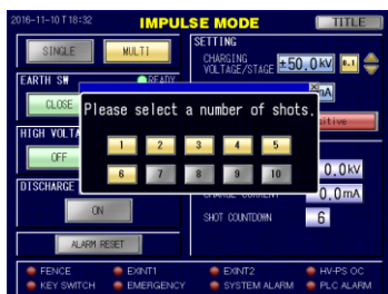
インパルス電圧発生試験 MULTI モード