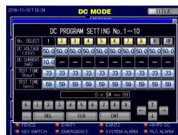
直流電圧発生試験 PROGRAM モード